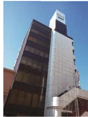
コンピューター総合研究所本社 (水戸駅前総研ビル)